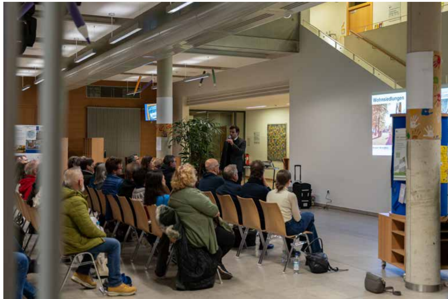
Oben und unten: Informationsveranstaltung mit vielen interessierten Anwohner*innen in der Grundschule am Amphionpark