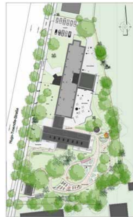
Planung Freiflächen © Over Landschaftsarchitektur