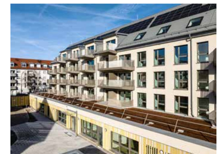
Unten: Hofansicht Gubestraße mit sozialen Einrichtungen im Erdgeschoss.

nomie, Kleingewerbe, Supermarkt) sowie Mobilitätsthemen (z. B. Quartiersgaragen, Mobilitätsstationen) präzisiert.