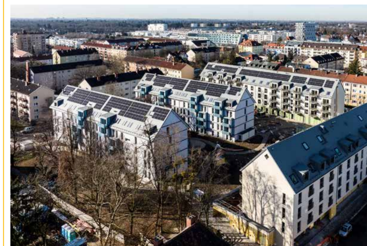
Links: Die neuen Wohngebäude in der Karlinger- und Gubestraße