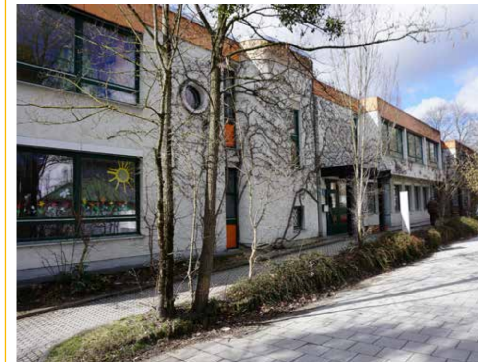
Ausgangssituation in der Gubestraße