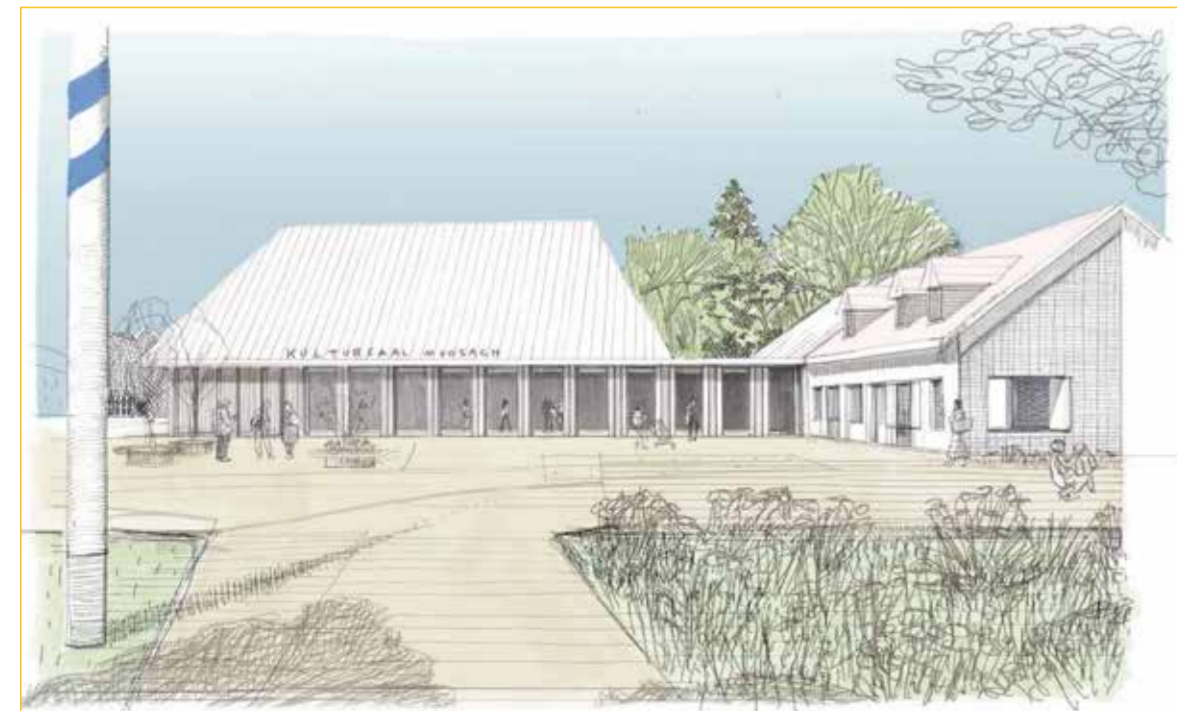
Visualisierung des Moosacher St.-Martins-Platzes mit saniertem Hacklhaus und Neubau des Kultursaals und Azubiwohnen